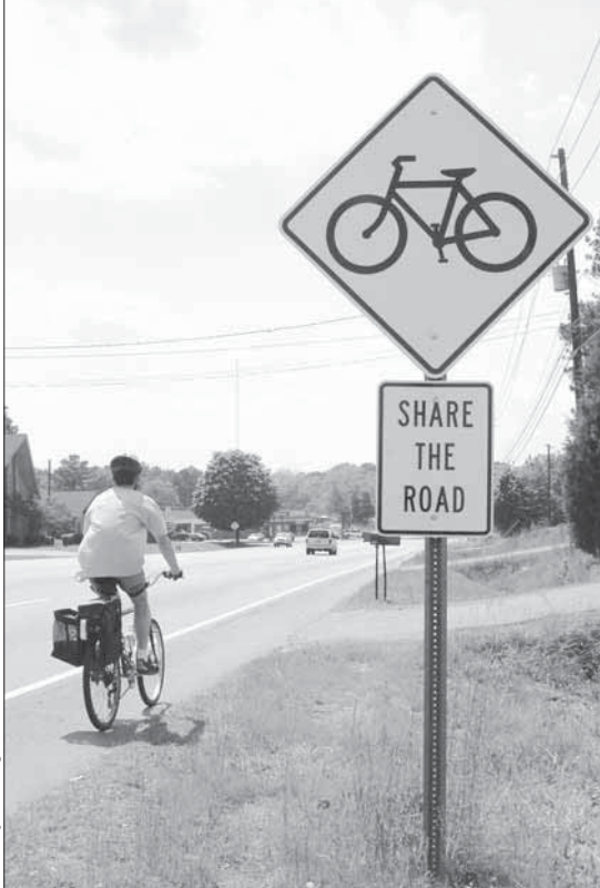
Día a día las señales que alientan a los conductores y a ciclistas a compartir la calzada son más comunes en Georgia.

circular en forma segura y ser siempre consciente de que se está compartiendo la calzada con otras personas. Asegúrese de mirar hacia atrás y hacia los costados antes de sobrepasar a otro ciclista o de cambiar posiciones. Nunca siga a otros ciclistas directamente a través de una intersección. Asegúrese de que no haya tránsito antes de avanzar. Tampoco adquiera el hábito de gritar “despejado” cuando atraviese una intersección para hacerles saber a los demás que se puede avanzar porque, cuando ellos estén listos para cruzar, sí puede haber tránsito. Cada ciclista debe comprobarlo personalmente antes de cruzar una intersección.