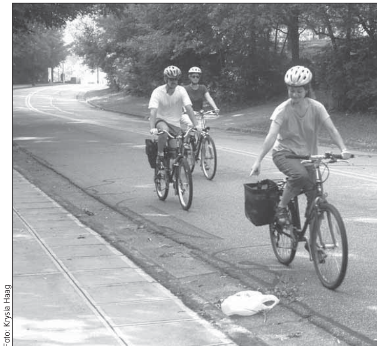
Advierta a los ciclistas que le siguen sobre la presencia de basura, rejillas o arenilla en la calzada señalando el peligro con el dedo.

circular en forma segura y ser siempre consciente de que se está compartiendo la calzada con otras personas. Asegúrese de mirar hacia atrás y hacia los costados antes de sobrepasar a otro ciclista o de cambiar posiciones. Nunca siga a otros ciclistas directamente a través de una intersección. Asegúrese de que no haya tránsito antes de avanzar. Tampoco adquiera el hábito de gritar “despejado” cuando atraviese una intersección para hacerles saber a los demás que se puede avanzar porque, cuando ellos estén listos para cruzar, sí puede haber tránsito. Cada ciclista debe comprobarlo personalmente antes de cruzar una intersección.